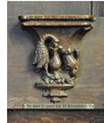
detail van de koorbanken