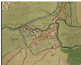
Aarschot op de kaart van Jacob van Deventer uit 1570. In 1578 viel de stad ten prooi aan een stadsbrand na de Plundering van Aarschot

Een derde verklaring ten slotte stelt dat de naam afkomstig is van de woorden Arend en schot , een afgebakende ruimte. Aarschot was dan aanvankelijk "een schuilplaats voor vee, waar tevens een arend werd gezien".