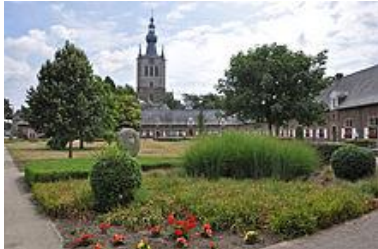
Begijnhof en toren van de Onze-Lieve-Vrouwekerk