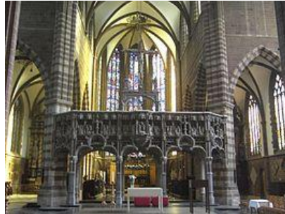
Doksaal, triomfkruis en koor