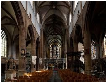
binnengezicht met kerkschip, doksaal en koor